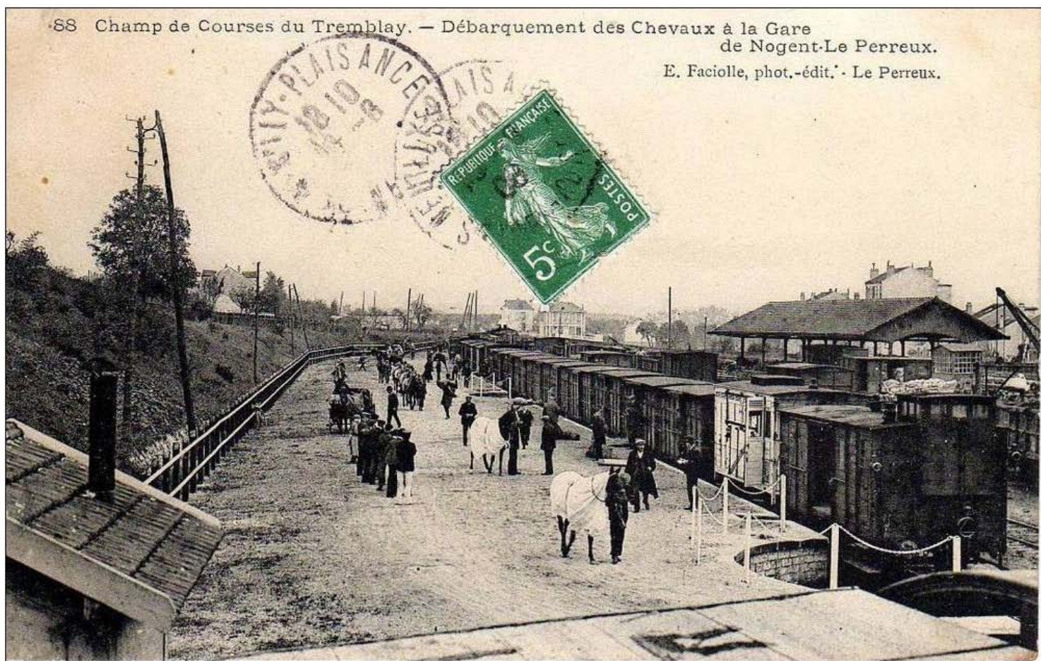
88 Champ de Courses du Tremblay. — Débarquement des Chevaux à la Gare de Nogent-Le Perreux.