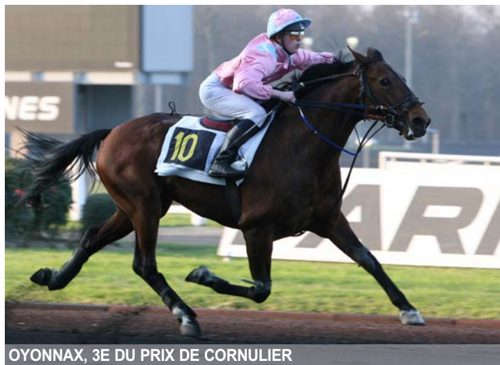
OYONNAX, 3E DU PRIX DE CORNULIER